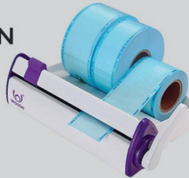
SELADORA NEW SELIN