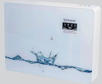
PURIFICADOR DE ÁGUA WPS