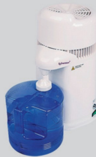
DESTILADORA DRINK 10