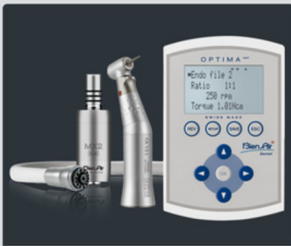
MICROMOTOR BIEN AIR