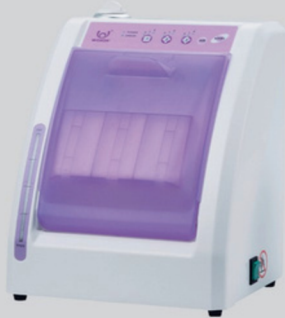
LUBRIFICADORA LUB 909