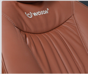
ESTOFAMENTO EM COURO SOFT PLUS