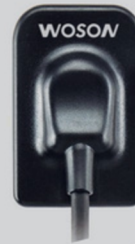
SENSOR DIGITAL RAYIN