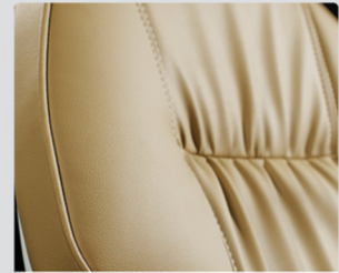
ESTOFAMENTO EM COURO SINTÉTICO SOFT ERGO